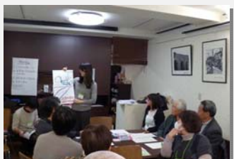
遠賀堀川の未来を考える輪い話し夢会議(2015. 12)