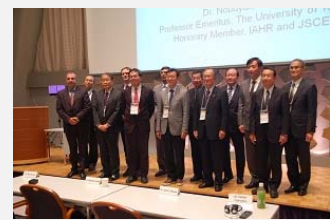
世界工学会議・河川国際シンポジウム（2015. 11）