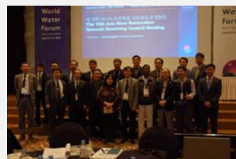
第 12 回水辺・流域再生国際フォーラム(2015. 4)