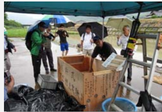
彼袴おもしろ河川団「アユ遡上実験」(2015. 5)