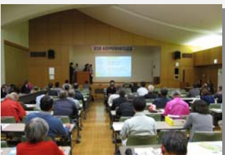
東彼袴町「水辺からのまちおこし広場」(2015. 11)