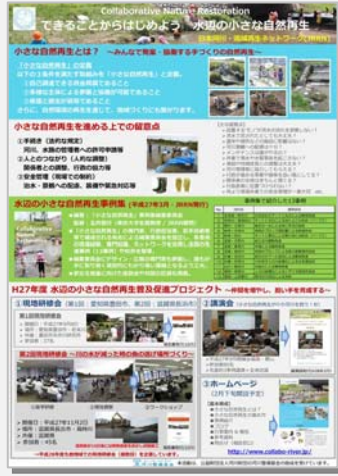
「小さな自然再生」ポスター発表