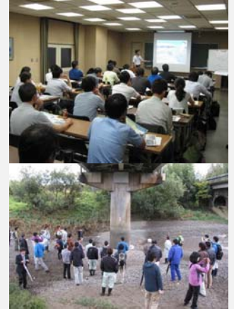
「小さな自然再生」現地研修会（2015. 9/2015. 11）