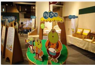
水の巡回展ネットワーク「雨といきもの展」