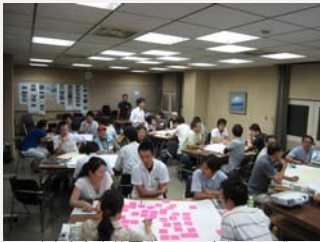
「小さな自然再生」ワークショップ