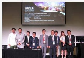
第 18 回国際河川シンポジウム分科会(2015. 9)