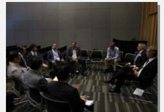
国際河川財団との技術交流(2015. 9)