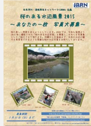
「桜のある水辺風景 2015」公募