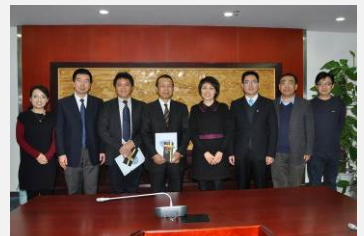
中国水利水電科学研究院との技術交流(2016.11)