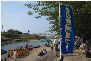
彼杵おもしろ河川団「そのぎ川まつり」(2016.8)