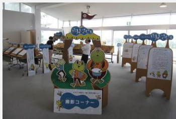
水の巡回展ネットワーク 企画運営協力