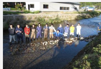
多自然川づくり現地研修会 in 東北(2016.10)