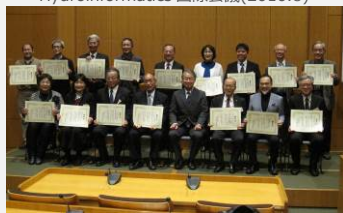
平成 28 年度 河川基金助成事業優秀成果表彰