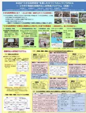
「小さな自然再生人材育成」ポスター発表