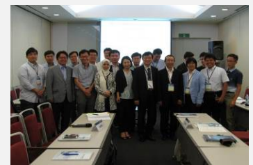
第 13 回水辺・流域再生国際フォーラム(2016.8)