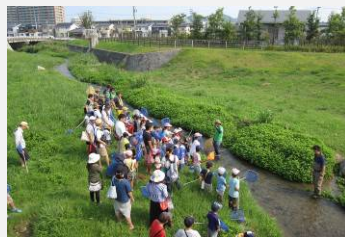
川遊び体験と灯明づくり in 上西郷川(2016.7)