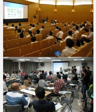
「桜のある水辺風景 2017」公募 「小さな自然再生」研修会&自由集会(全 4 回)