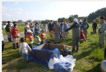
みんなで取り組む武庫川づくり交流会(2016.10)