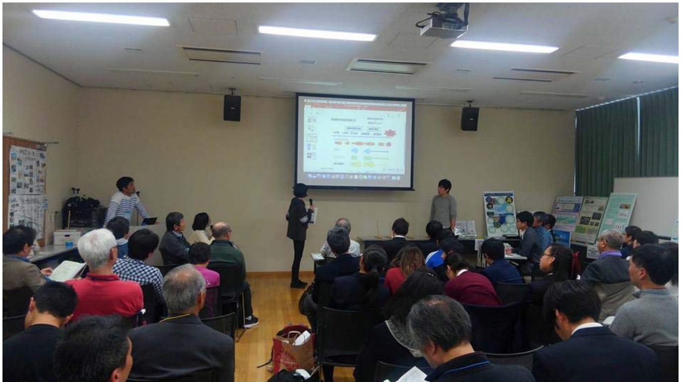
図3 「常総市を防災先進都市へ！！」発表の様子

第12回「川の日」ワークショップ関東大会実行委員会と国土交通省 関東地方整備局の方々、そして発表を聴いてくださった皆さんにこの場を借りて感謝を申し上げます。