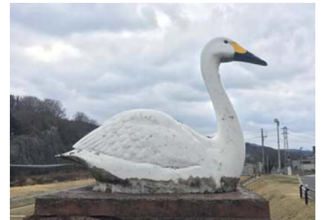
橋に飾られた白鳥のオブジェ

白鳥は美しい見た目とは反してきゃーきゃーと、はしゃいでいる様な声で鳴く。土手に止めた車のドアを開け、その声が聞こえると私の胸は飛び上がるように高鳴るのだ。土手から転がるように河原に走り降りると、両手にかっぱえびせんが何袋も入ったビニール袋を持つ祖父母を携え、私はただひたすらかっぱえびせんを白鳥たちに向かって投げる。周りにも同じような家族連れがいたが、我が家のかっぱえびせんの量はどこよりも多かったと思う。手のひらいっぱいにつかんで、白く大きい白鳥に向かって何十分も何度も何度も投げる。気合が入りすぎて、終り頃は細かく潰れたえびせんが手のひらにベトベトくっついていて、