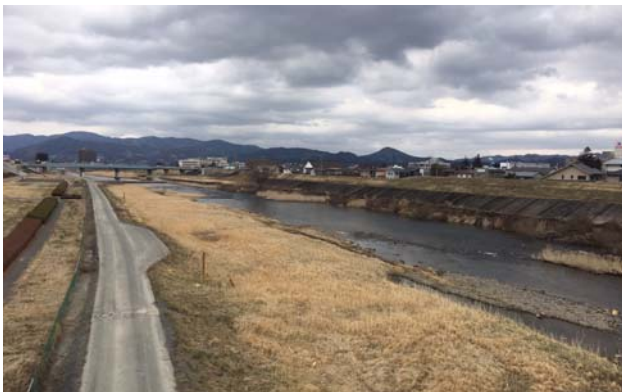
まち中を流れる磐井川

その時、近くでバタバタと音が聞こえた。目をやると羽ばたく一羽の白鳥が目に入った。まだ旅立たない白鳥が残っていたのだ。私が子供のころ「生きていて欲しい」と願った子ではないのかもしれないが、私の胸には懐かしさと喜びが溢れた。私の居場所がこの地に今もあるとその白鳥は言ってくれているように感じた。