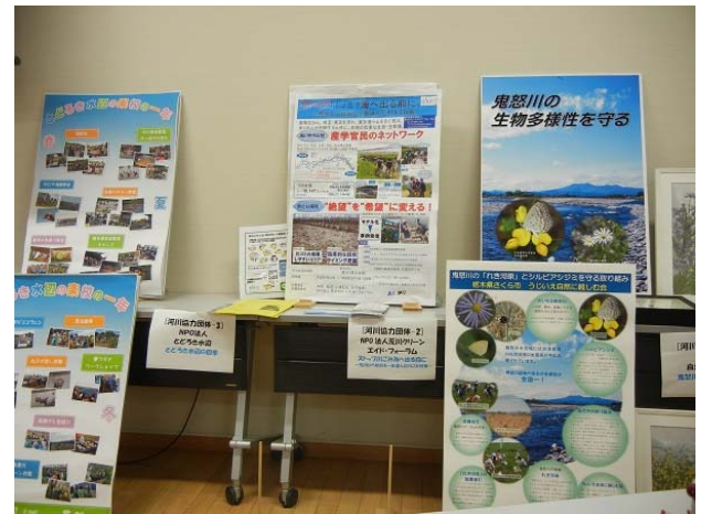
図2 活動団体のポスター

ーマにしたAグループから発表が始まり、地域・水環境・防災・情報のBグループの発表を続けていきました。そして、参加者全員からの投票をもとに、優秀賞と特別賞を決め、表彰式を行いました。