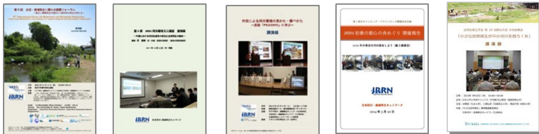
講演会・技術交流会・シンポジウム等の講演録や報告書（過去の主な成果）

河川再生の普及・啓発を目的に実施した行事等の成果、及び調査研究の成果を冊子として取りまとめ、全国への普及に努めます。