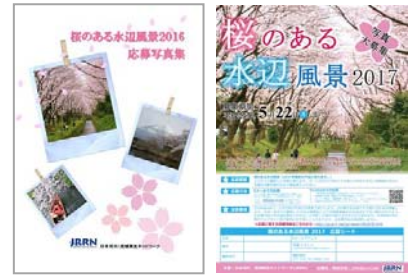
作品集と応募チラシ

水辺が創出する美しい景観の未来への継承を目的として、平成 29 年に撮影された「桜のある水辺写真」を一般より募集し、ソーシャルメディアで紹介するとともに、写真集としてとりまとめ普及します。