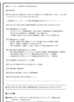
JRRN news mail