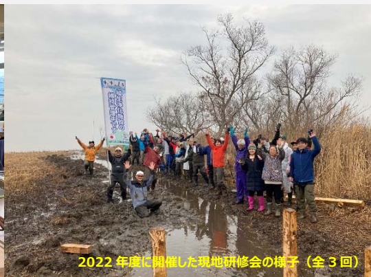
2022年度に開催した現地研修会の様子（全3回）