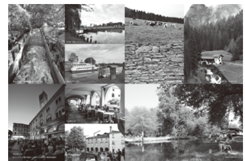
テラフェルマの風景