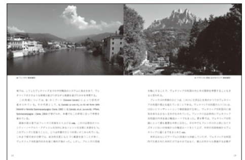
ヴェネツィア共和国を支えた川と流域