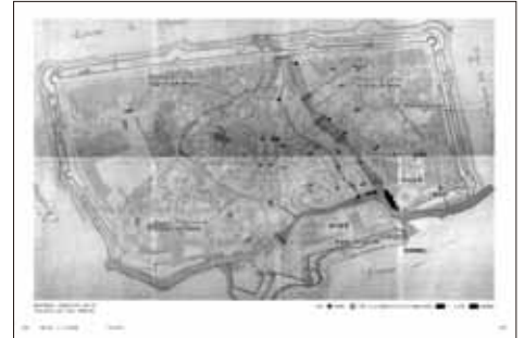
トレヴィアーゾの不動産台帳（1811年）

2016年3月10日発売／鹿島出版会／ISBN 978-4-306-07323-4 C3052