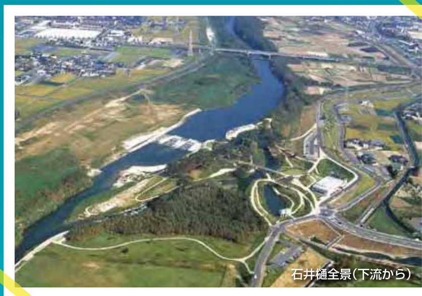
石井樋全景(下流から)

水と闘い、水の恵みを人々に届ける活動は現在も続いていますし、未来に向けた戦いも始まっています。石井樋400年に当たり、茂安の治績に思いをはせるとともに、佐賀平野の水の現状と未来像を探ります。